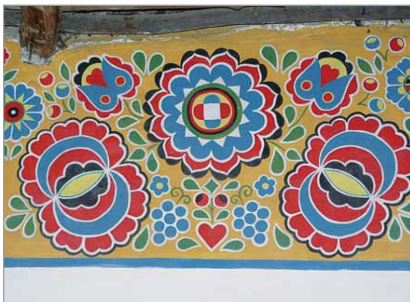
Obr. 7. Malba pocházející z padesátých let 20. století, zachycen stav v roce 2000, dnes již zbořeno, Hluk 2000.