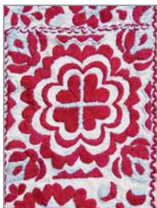
Obr. 15. Výšivka mužské košile z druhé poloviny 19. století, Hluk 2009.