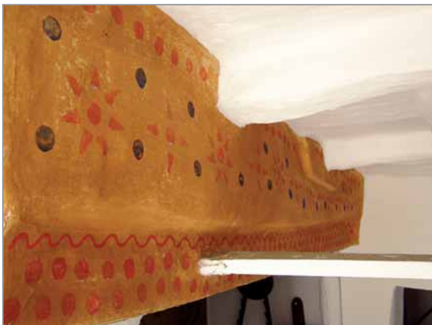
Obr. 2. Podstropní pás s obtisky brambor, Hluk 2008.