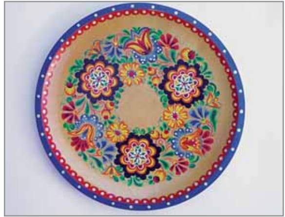
Obr. 9. Malovaný talířek od Antonie Machalové z Hluku, 2006.