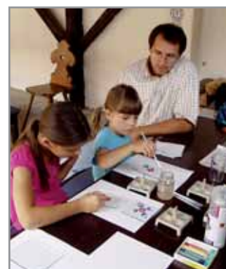
Obr. 12. Tvořivá dílna, Hluk 2009.