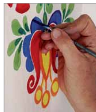
Obr. 13. Malování ornamentu, Hluk 2009.