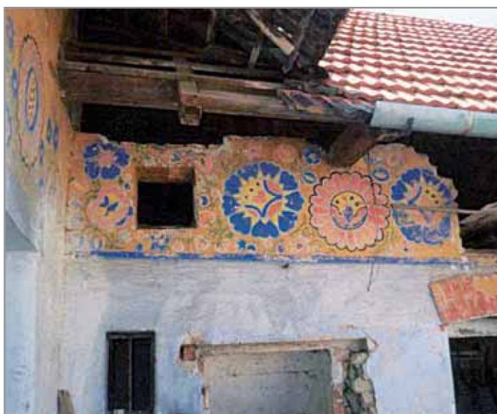
Obr. 6. Ornamet ze třicátých let 20. století, Hluk.