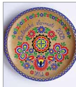
Obr. 11. Malovaný talířek z Hluku, 2005.