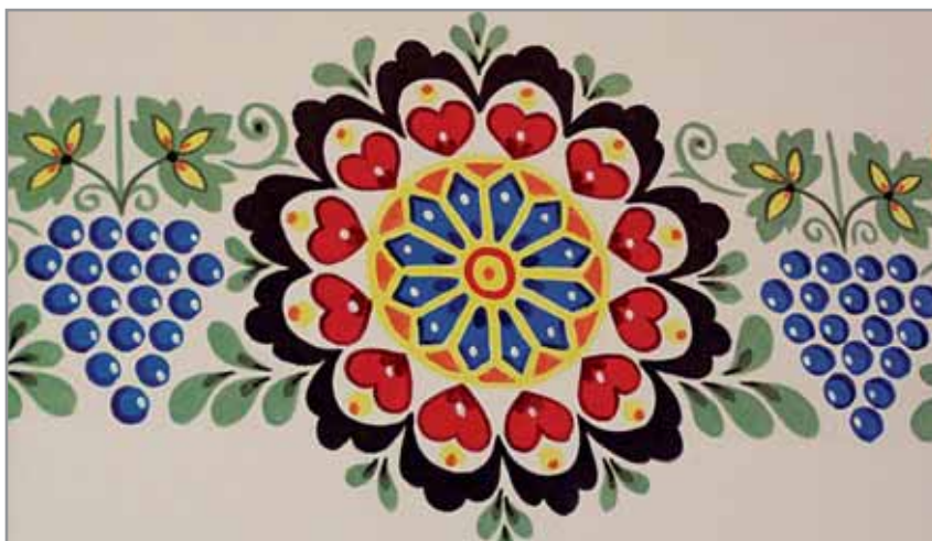
Obr. 14. Motiv hlucké růže od Marie Páčové, Hluk 2009.