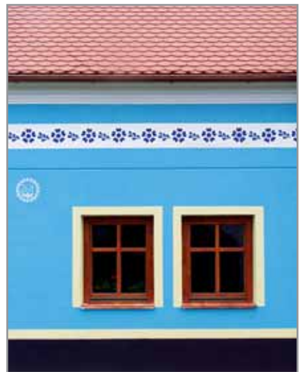
Obr. 4. Malba okolo popisného čísla, Hluk 2010.