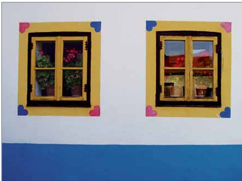
Obr. 3. Šambrány okolo oken, Hluk 2008.